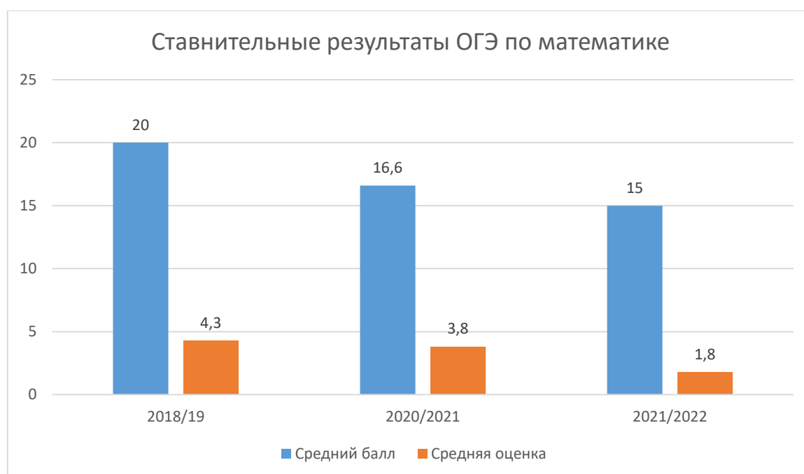
Диаграмма 2. Результаты ГИА по математике в сравнении за три года.

9 обучающихся (64%) получили отметки, ниже годовых. 1 ученик получил отметку выше годовой. Это говорит о необъективности оценивания знаний обучающихся учителем математики.